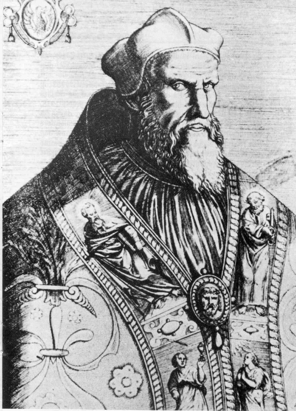
GREGOR 13, den store — pave (1572–1585), korrigerede feilen i den julianske kalender. Hans kalender, den gregorianske kalender, er den som i dag er i bruk.